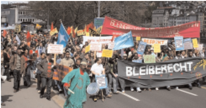
3000 Personen fordern ein Bleiberecht für alle

Im Dezember 2007 wurde mit der Besetzung des Grossmünsters in Zürich die Kampagne «Bleiberecht für alle!» lanciert. Sie zielt auf den gemeinsamen Kampf von Menschen mit und ohne legalem Aufenthaltsstatus für menschenwürdige Lebensbedingungen in der Schweiz. So sind Kollektive in Zürich und Bern entstanden, frei nach dem Motto «Schluss mit reagieren, auf in die Offensive!» augenauf Bern ist aktiv dabei.